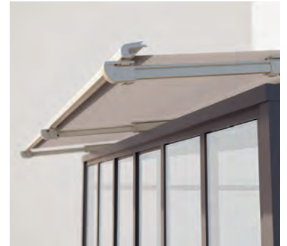
PS6100 Ausfahrbare Ausladung