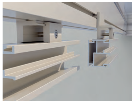
Aussenbündige oder eingerückte Montagemöglichkeit