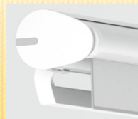
Ohne Vario-Volant Mit Vario-Volant