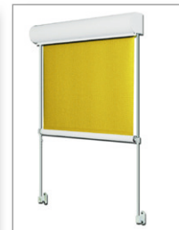
Lero IV mit Stangenführung