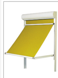
Lero III mit Markisolette, erhältlich mit Torsionsfeder 155°, Gasdruckfeder 145°