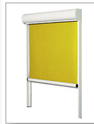
Lero I mit Schienenführung