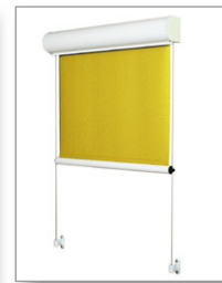
Lero II mit Seilführung